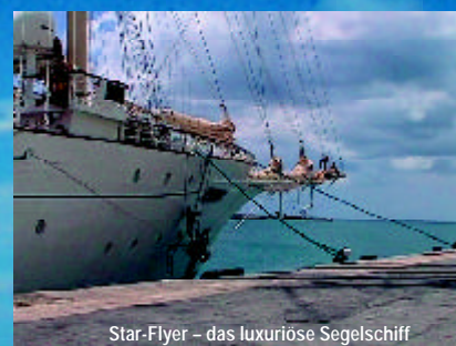
Star-Flyer – das luxuriöse Segelschiff