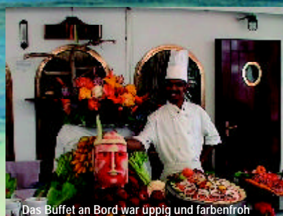
Das Buffet an Bord war üppig und farbenfroh